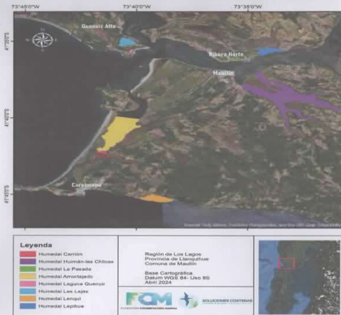
Figura 1. Humedales que regula la presente Ordenanza